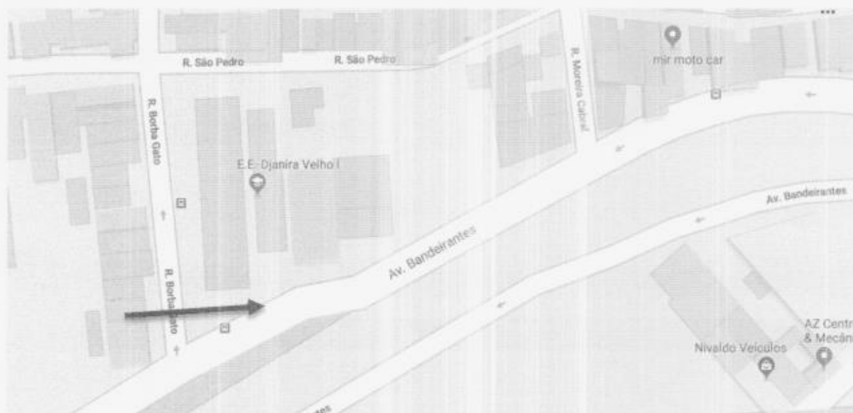
Trecho Av. Bandeirantes – próximo R. Borba Gato