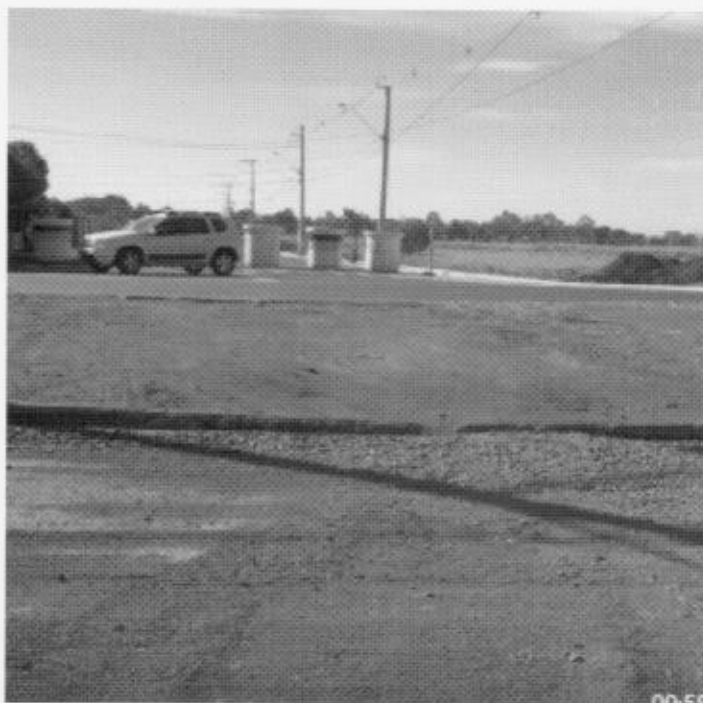
Foto do Canteiro central utilizado de forma irregular pelos caminhões que transportam materiais para Empreendimento da Construtora MRV na Avenida José Antônio Ferrarezi, 3023.