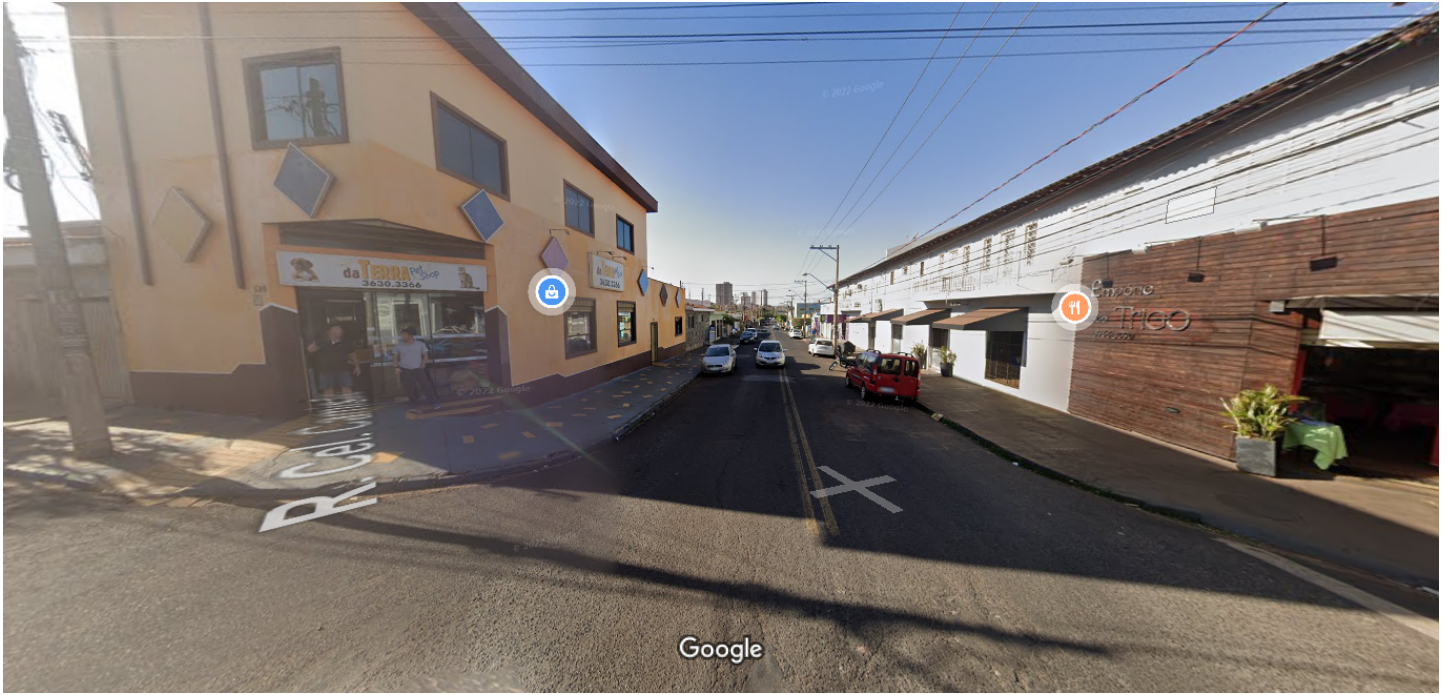
Captura da imagem: jul. 2022