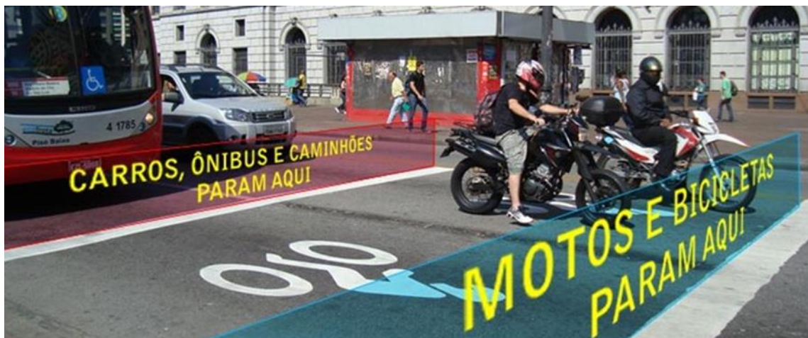
Figura 02: ilustração da implantação da sinalização para motocicletas.