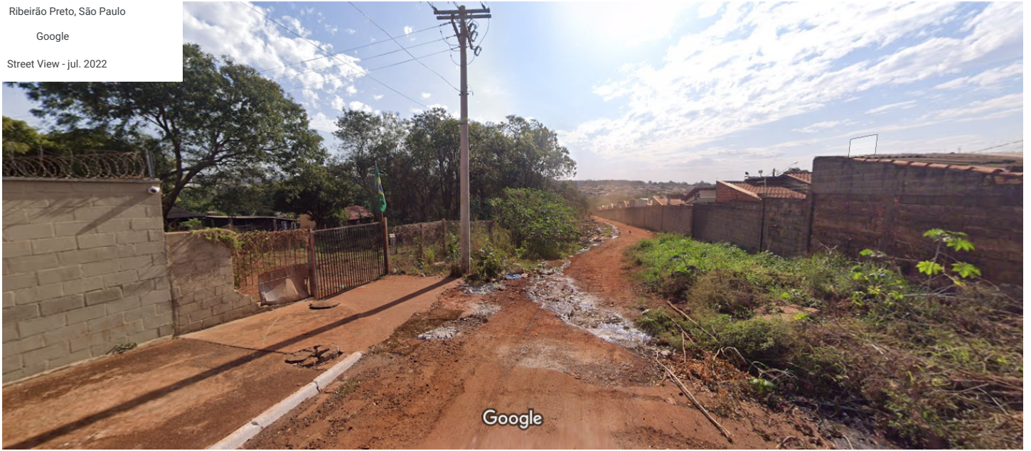
Captura da imagem: jul. 2022