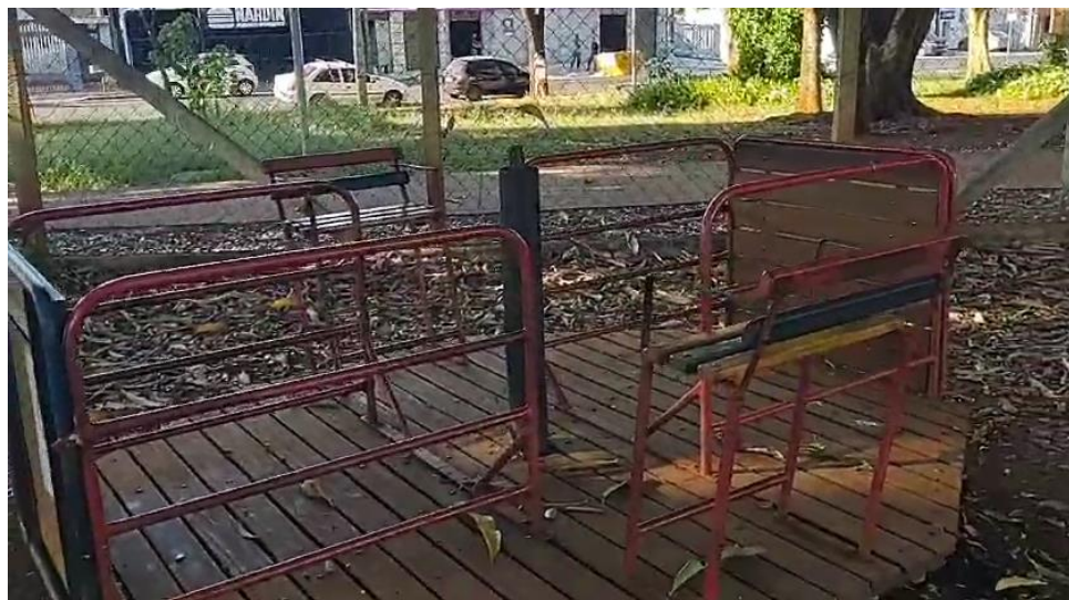
7 - gira-gira danificado e sem funcionar

Assim, REQUEREMOS , respeitosamente, nos termos constitucionais e regimentais, após ouvido o Egrégio Plenário, seja o presente encaminhado ao Excelentíssimo Sr. Prefeito, para que determine a manutenção dos brinquedos da Praça Ali Yussef Abou Hamin, conforme exposto.