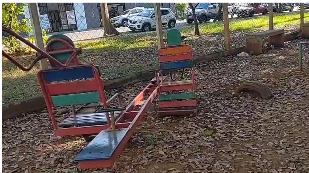
4 - gangorra fora do lugar