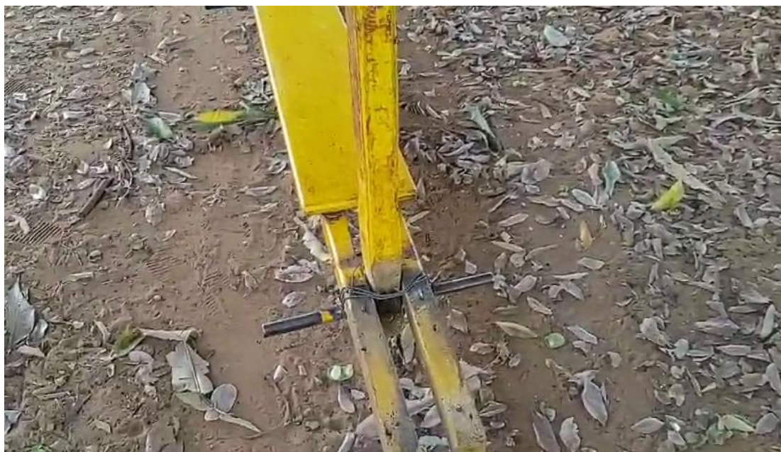
3 - pregos expostos