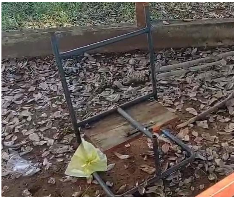
5 - cadeira de brinquedo quebrada