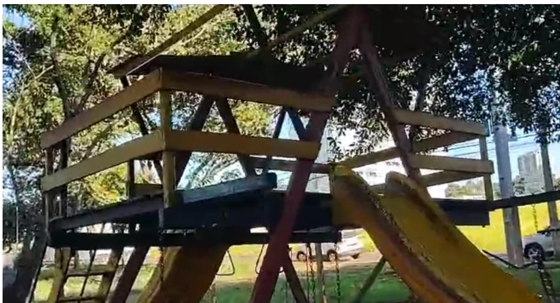
1 - estrutura sem telhado

Contudo, até a presente data, os reparos não foram feitos e o lazer local vem sendo prejudicado, conforme imagens a seguir: