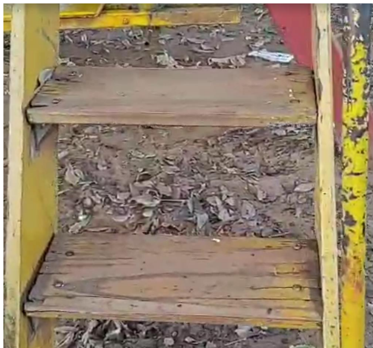
2 - escada com degraus soltos e madeira podre