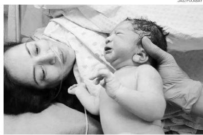
Conselho Federal de Enfermagem (Coren) estabeleceu normas para a atuação de enfermeiros obstétricos e obstetrixes no parto domiciliar planejado

A atuação dos profissionais também é ressaltada, uma vez que “no Brasil, a redução da mortalidade materna está relacionada à ampliação da oferta da saúde reprodutiva, e uma assistência obstétrica