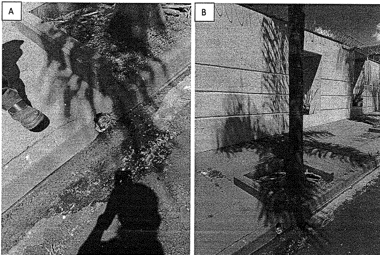
Figura 2: (A-B) – Escoamento de água com grãos como quirela de milho e sementes de girassol, provenientes do imóvel localizado na Rua Deolinda Carvalho Bim, nº 310. Esses grãos estão servindo como fonte de alimento para os pombos.

Desta forma, esgotadas as tentativas de vistorias no local, e considerando o risco à saúde que a população vizinha está exposta, estamos encaminhando à Divisão de Vigilância Sanitária para que o proprietário do imóvel localizado na Rua Deolinda Carvalho Bim, nº 310 seja notificado e se responsabilize por não ofertar alimentos aos pombos. Sendo o que se apresenta para o momento, coloco-me a disposição para maiores esclarecimentos.