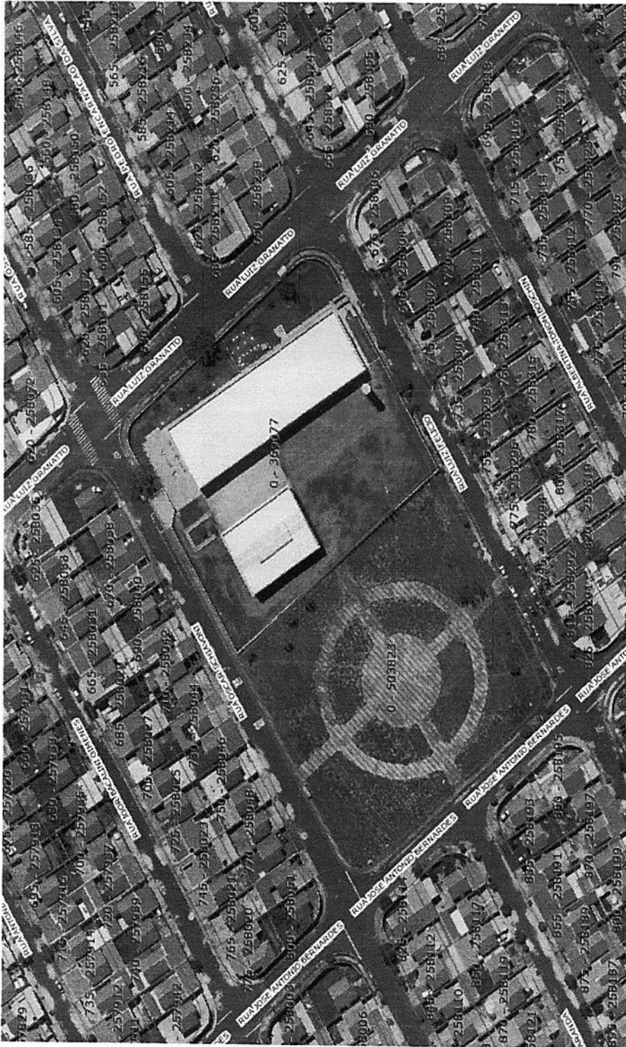
Área Verde - Sistema de Lazer E- Lotm. Jd. Dr. Paulo Gomes Romeo- CAD 503823- PMPR-105396/2021- Req. 3333