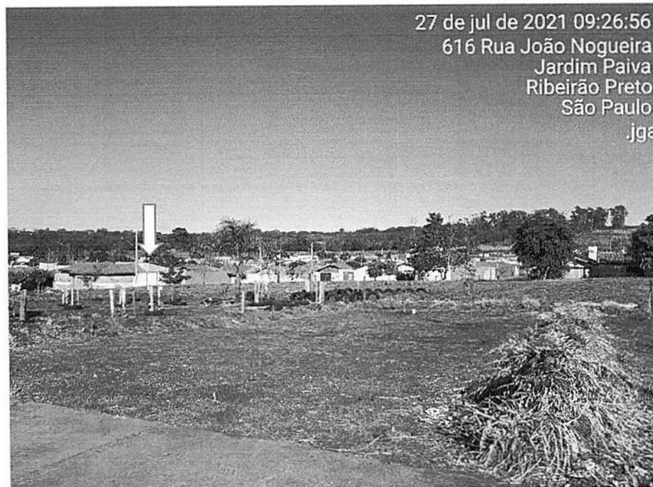
Detalhes dos plantios.

PREFEITURA DA CIDADE RIBEIRÃO PRETO GLOBAL E ACOLHEDORA