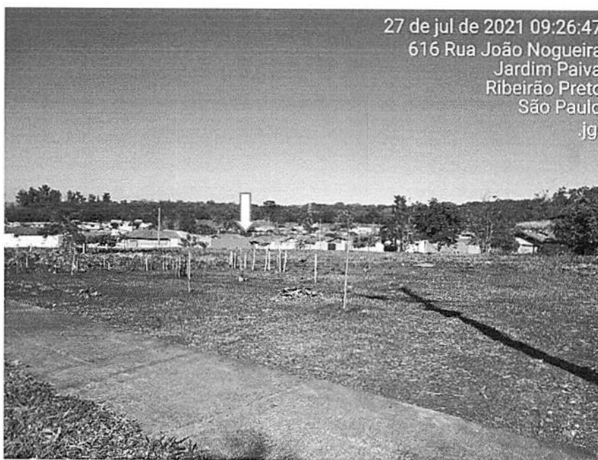
Detalhes dos plantios.