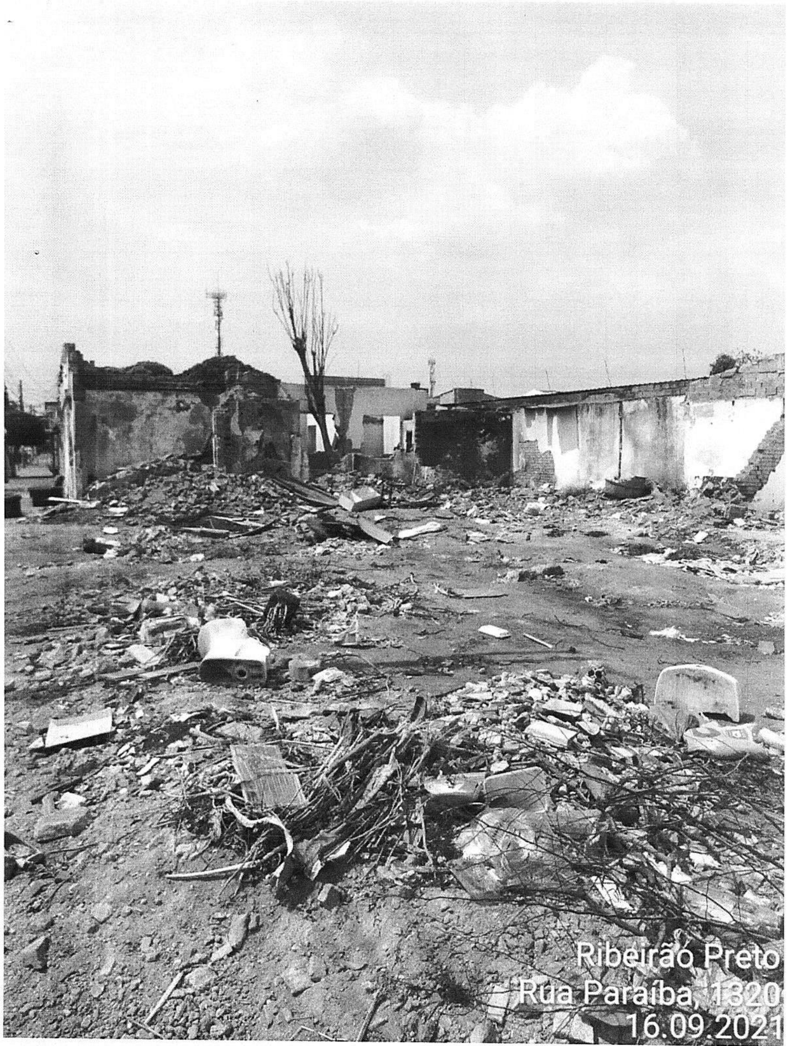
Ribeirão Preto Rua Paraíba, 1320 16.09.2021