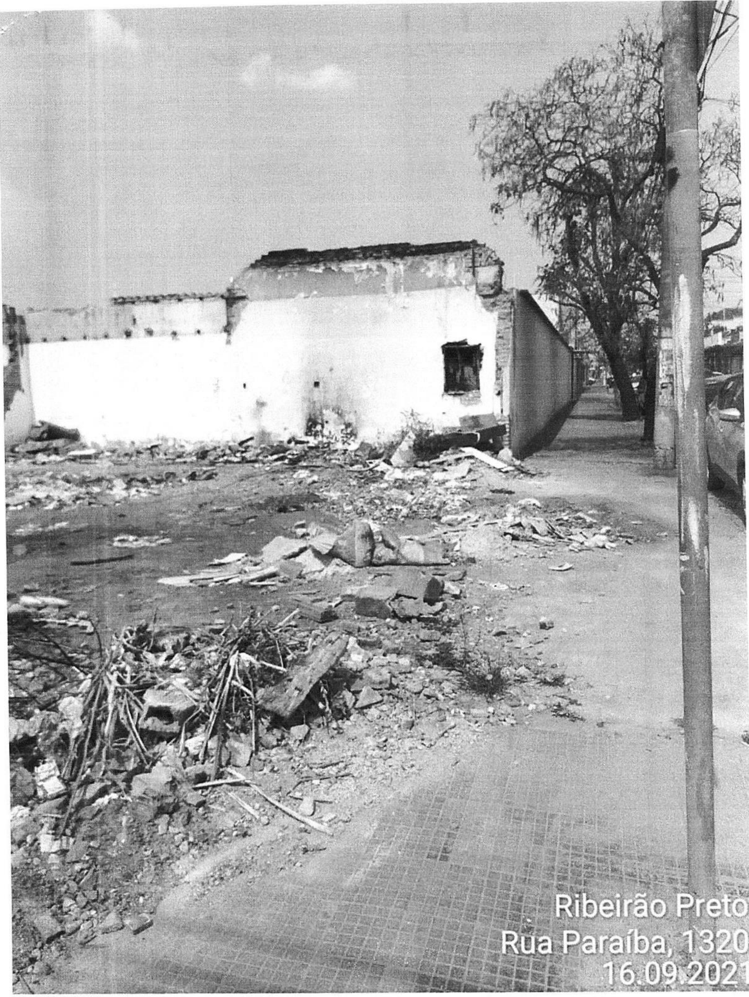
Ribeirão Preto Rua Paraíba, 1320 16.09.2021