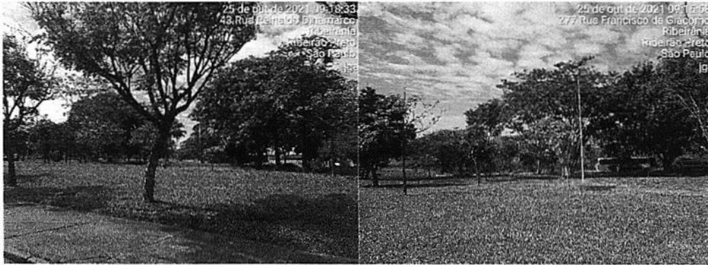
Praça Francisco Gê Acaiaba de Montezuma e Itália (Ribeirânia) em 25/10/2021.

As praças urbanizadas dos bairros Nova Ribeirânia e Ribeirânia receberam os serviços de corte do gramado e limpeza geral entre 20 e 23/10/2021.