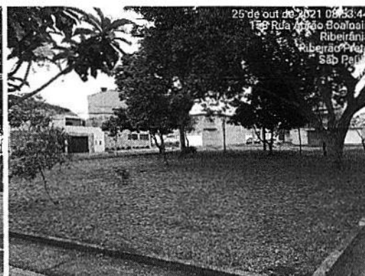
Praças Antônio Emacura e Apamagis (Nova Ribeirânia) em 25/10/2021.