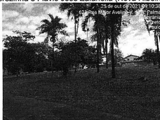
Praça sem denominação entre as Ruas Lamartine Belém Barbosa e Major Avelino Alves Palma (Ribeirânia) em 25/10/2021.

A poda de manutenção do arboredo vem sendo realizada dentro da programação desta Divisão. Das praças citadas acima, as praças Jorge Amado, Apamagis, Antônio Emacura e as duas áreas verdes da Rua José Pierre já foram atendidas nos últimos doze meses.