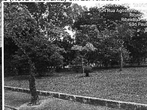
Praças Dr o Santa Terezinha e Flávio José Zafanella (Nova Ribeirânia) em 25/10/2021.