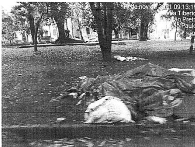
Detalhe de lixos diversos pela praça.