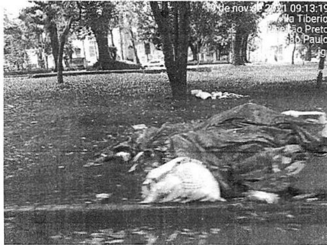
Detalhe de lixos diversos pela praça.