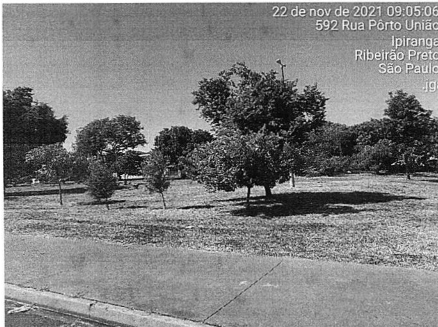
Foto do último corte do gramado registrada em 22/11/2021.

A Praça Terezinha de Souza Moresca recebeu o serviço de corte do gramado em fevereiro, março, maio e julho do corrente, e mais recentemente em 20/11/2021, devendo ser novamente atendida dentro da programação desta Divisão neste ciclo de corte que se estenderá até meados de julho/2022.