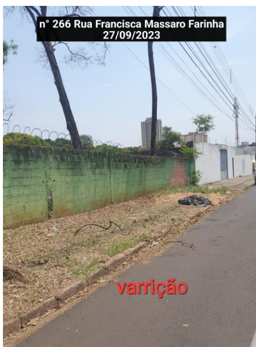
n° 266 Rua Francisca Massaro Farinha 27/09/2023