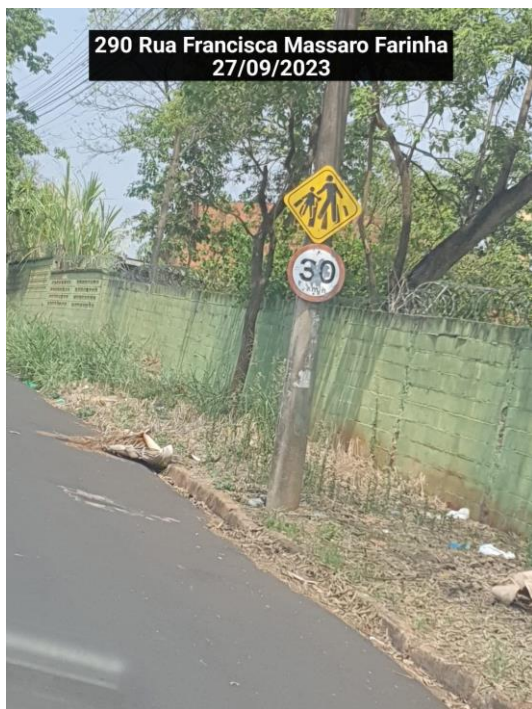
290 Rua Francisca Massaro Farinha 27/09/2023

A Divisão de Limpeza Pública informa que foi feita vistoria no local. O serviço de limpeza (Varrição, Capina de meio fio consta em nossa programação e será realizado conforme demanda da Divisão, conforme fotos abaixo: