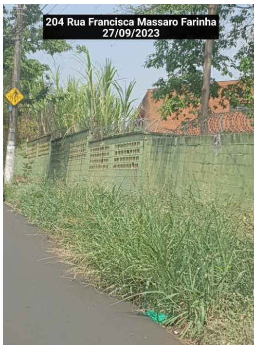
204 Rua Francisca Massaro Farinha 27/09/2023