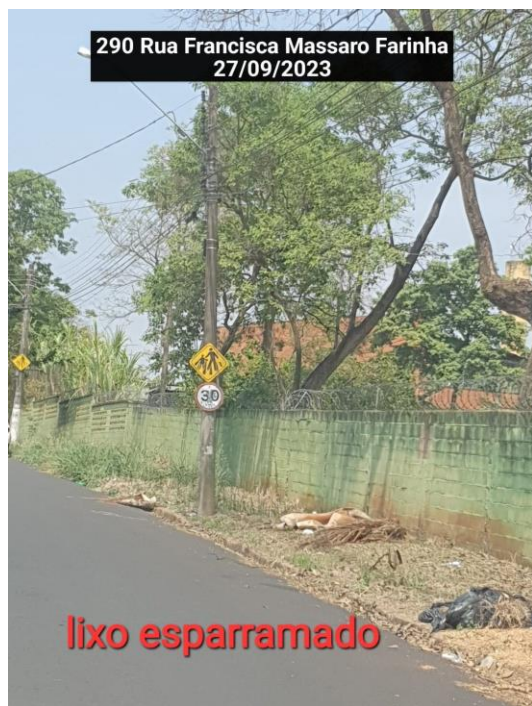
290 Rua Francisca Massaro Farinha 27/09/2023