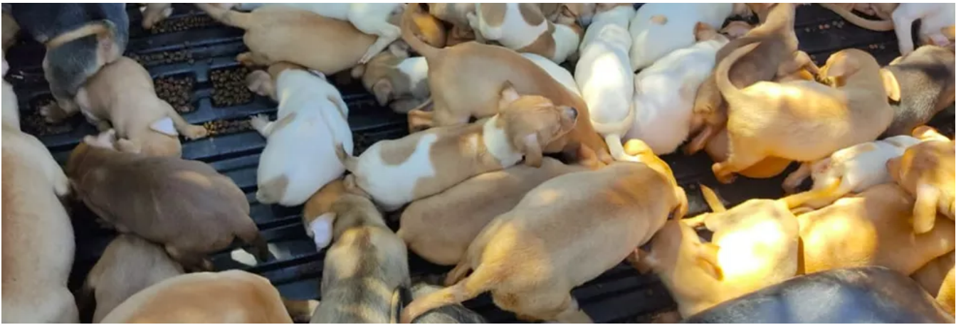
Filhotes resgatados de casa em Ribeirão Preto, SP, lotam caçamba de caminhonete