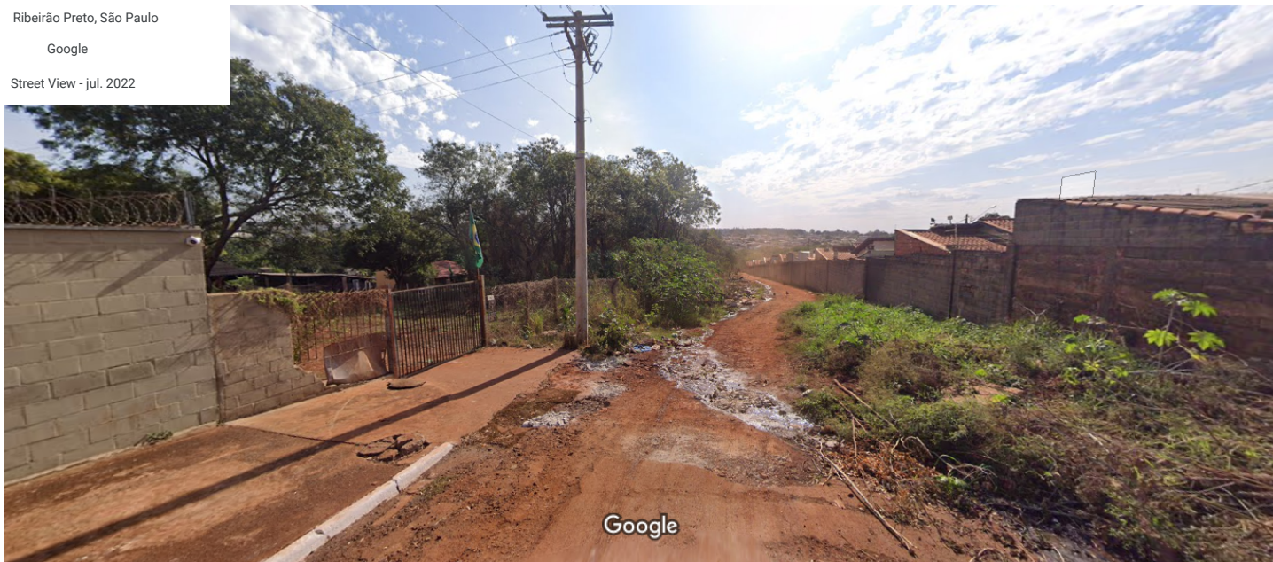
Captura da imagem: jul. 2022