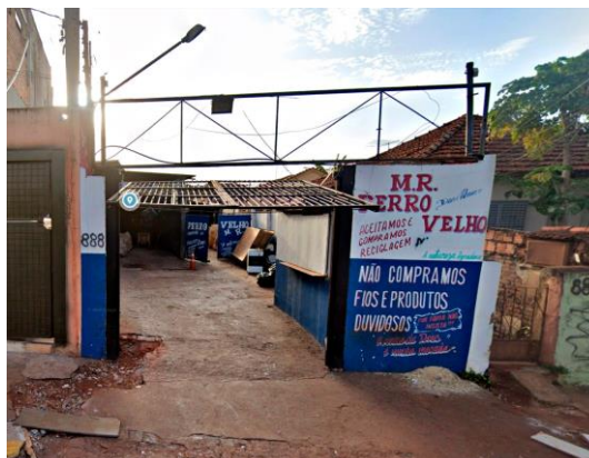
Rua Castro Alves, 888 (próximo à Rua Aurora)

Considerando a importância de garantir a segurança, ordem e bem-estar da população, bem como a preservação do meio ambiente, mediante o controle adequado desses estabelecimentos;