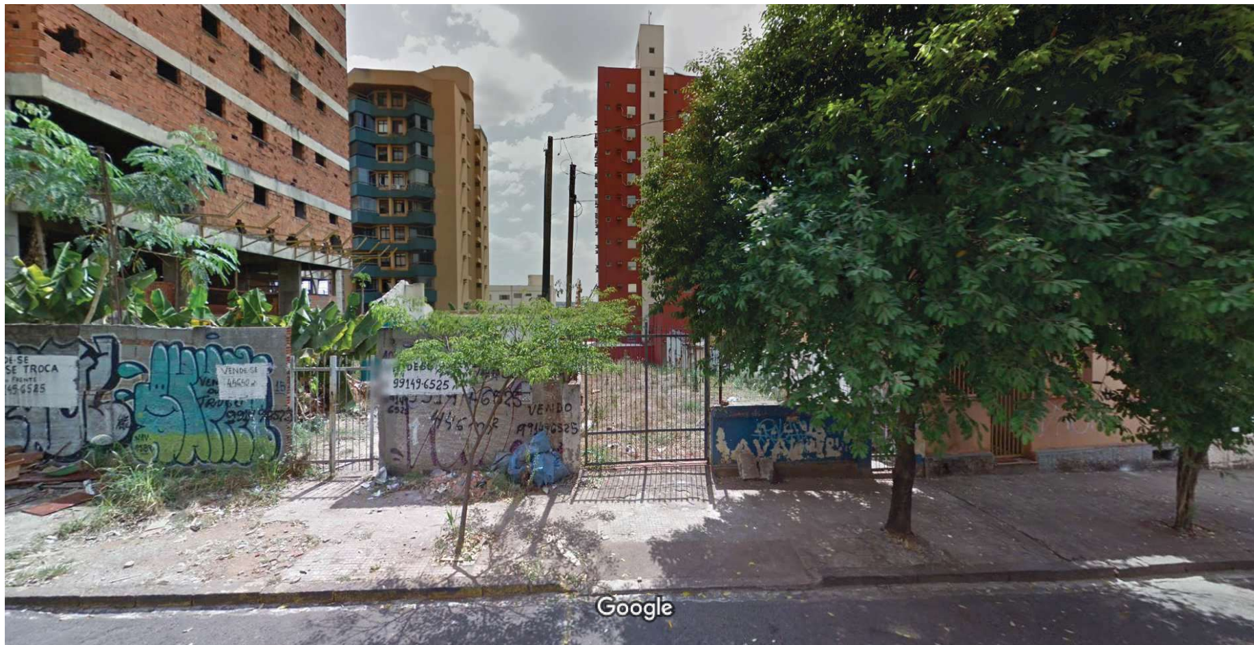
Captura da imagem: set. 2017